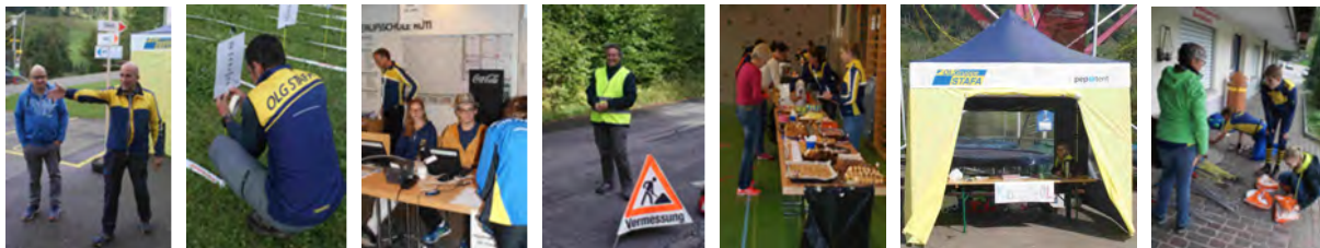
Impressionen Helfereinsatz ZH Oberländer 2016/2017